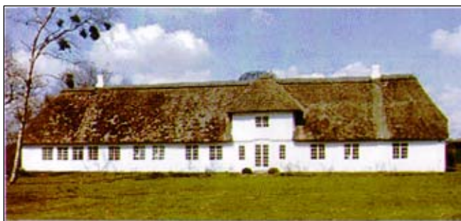
Darum Præstegård- ældste beboelse i Darum