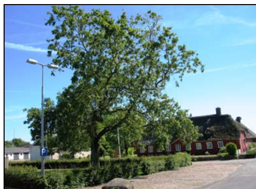
Kvinde Eg i Darum. Plantet 1915 til ære for at kvinder fik valgret.