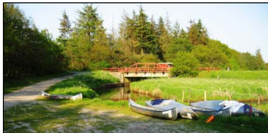
Røde Bro hvor der er opstillet borde med bænke.

Efter skoven svinges t.v. over et lille vandløb, Jordbro , og vi må nu en tur hen i nærheden af motorvejen, inden man igen kommer tilbage til den oprindelige vej, og kan følge den over Vester Bjerndrup, hvor jernbanen Bramming – Grindsted passerer, videre gennem det ældste Bjerndrup, tilbage til Gørding