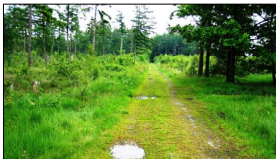
Vejen gennem Statsskoven

Kanosejlads i åen er tilladt, og kanoer kan bl.a. lejes hos Det Danske Spejderkorps i Bramming. Tlf. 75 17 31 71