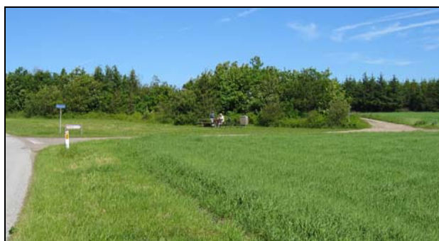
Bord og bæk på Rønnevej- Vibækvej. Grusvejen t. h. går gennem Sibrien