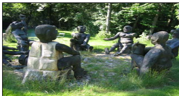
Byting i Hunderup