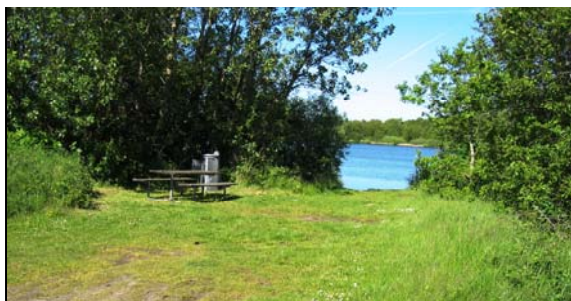
Dammose søen ved Kratskellet

Fremme ved Kjærgårdsvej drejes til venstre og efter ca. 100 m. er vi atter tilbage ved Brugsen.