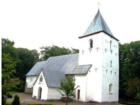
Sct. Knuds kirke