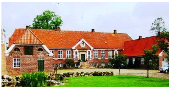
Hovedbygning på Bramming Hovedgård/ Sydvestjyllands Efterskole siden 1984