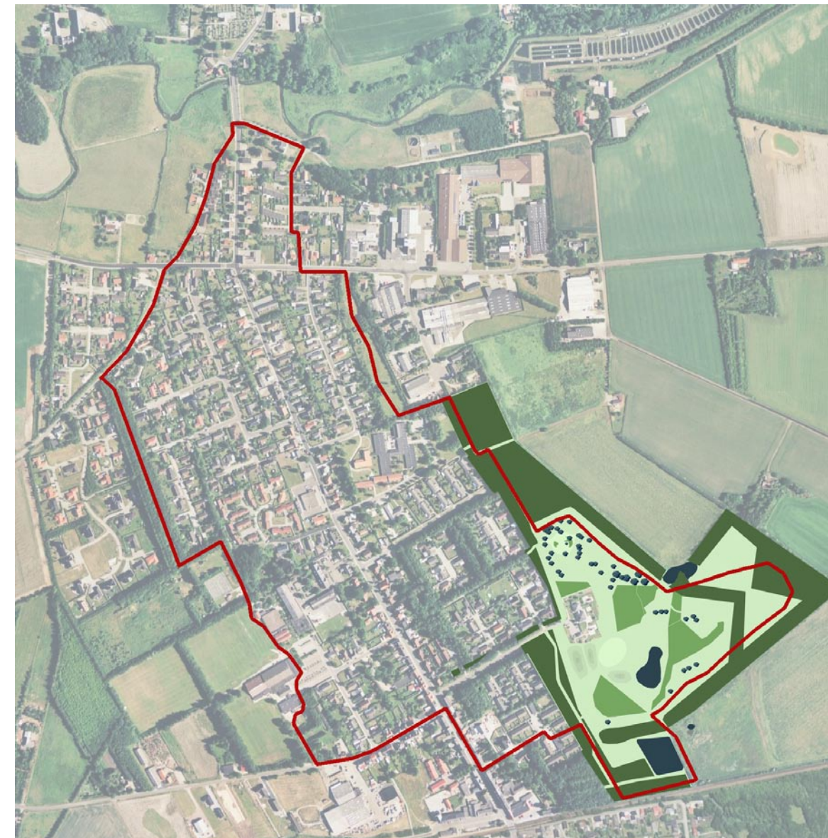
Forslag til Hjertersti rundt om Gørding