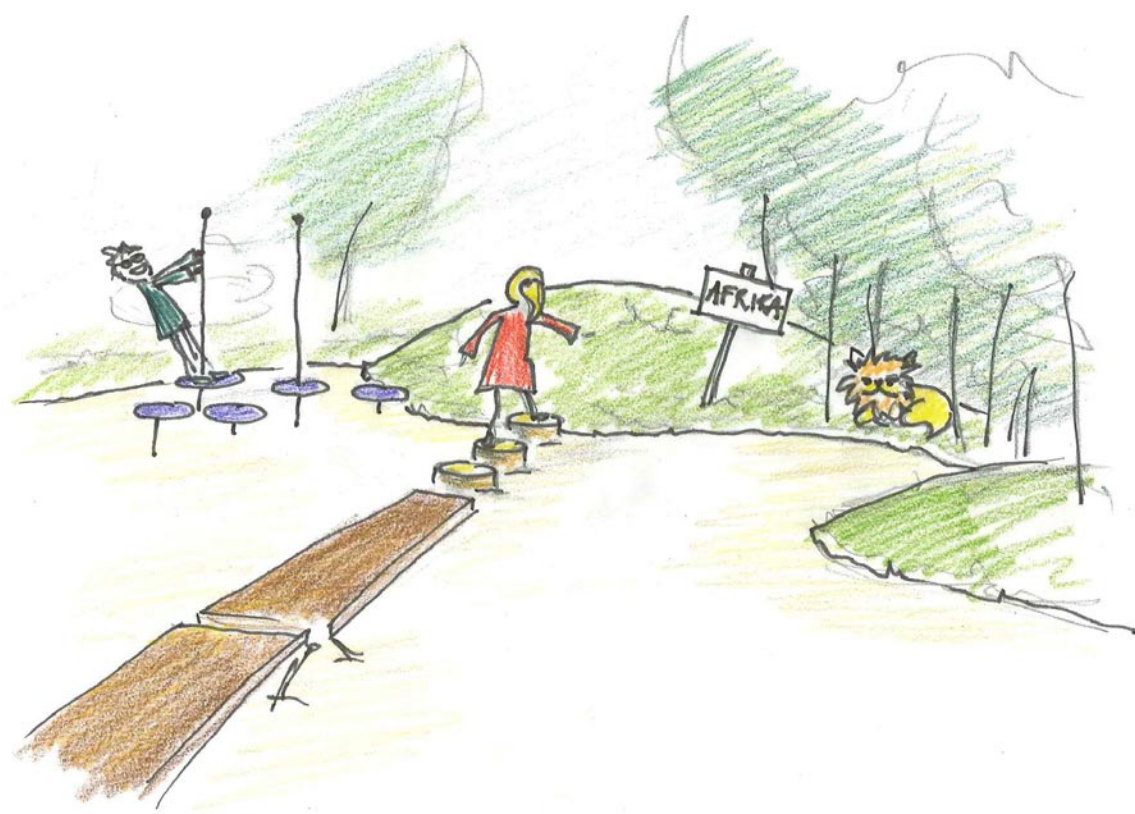
En balancebane forbinder de to kontinenter.

Legepladsens målgruppe er skolebørn på 6-12 år.